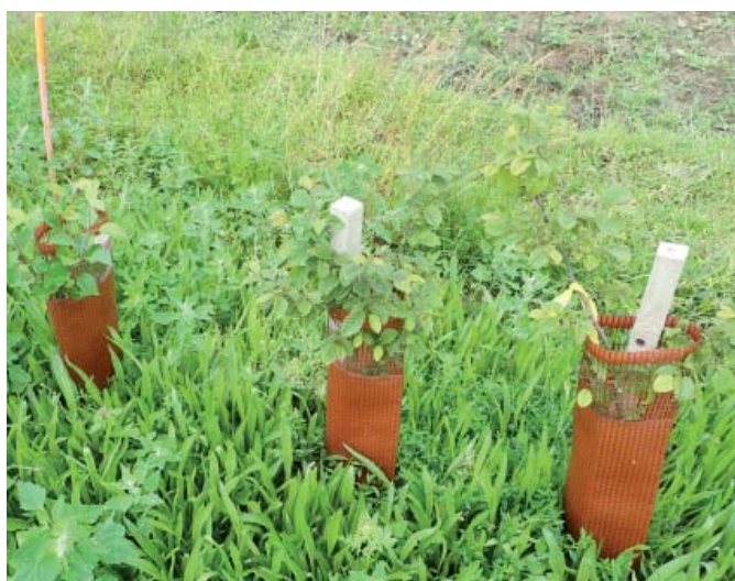
Photo de gauche : couvert de plantain lancéolé et protections individuelles pour vigne.

(PS : respecter scrupuleusement les densités de semis pour la phacélie, sinon elle fera concurrence)