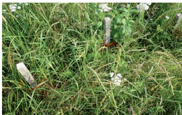
Photo ci-dessous : zone témoin sans couvert et sans dégagement (arbustes noyés dans les adventices).