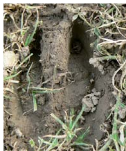
Empreinte de cerf