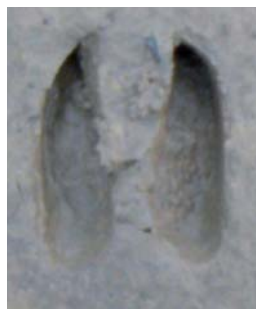
Empreinte de chevreuil