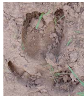
Empreinte de sanglier