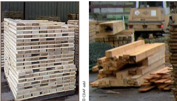
débîts de menuiserie