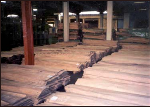
placage et merrains