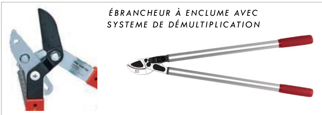
ÉBRANCHEUR À ENCLUME AVEC SYSTEME DE DÉMULTIPLICATION