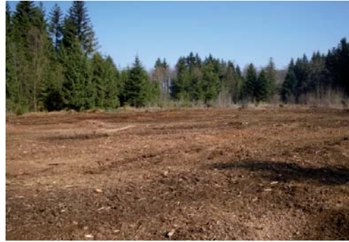
Terrain nettoyé après gyrobroyage : tapis de broyat ligneux