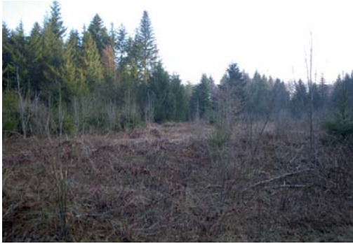
Obstacles avant gyrobroyage : recrûs naturels et rémanents de coupe

Le GYROBROYAGE assure une mise à nu parfaite du terrain par ÉLIMINATION COMPLÈTE OU PARTIELLE DE LA VÉGÉTATION EN PLACE OU DE RÉMANENTS laissés sur le terrain suite à l'exploitation du bois, après un DÉLAI DE 6 MOIS À 1 AN pour faciliter le broyage des branches.