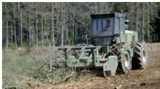
Nettoyage de terrain au broyeur à dents fixes