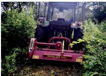
Cloisonnement culturel au gyrobroyeur à marteaux