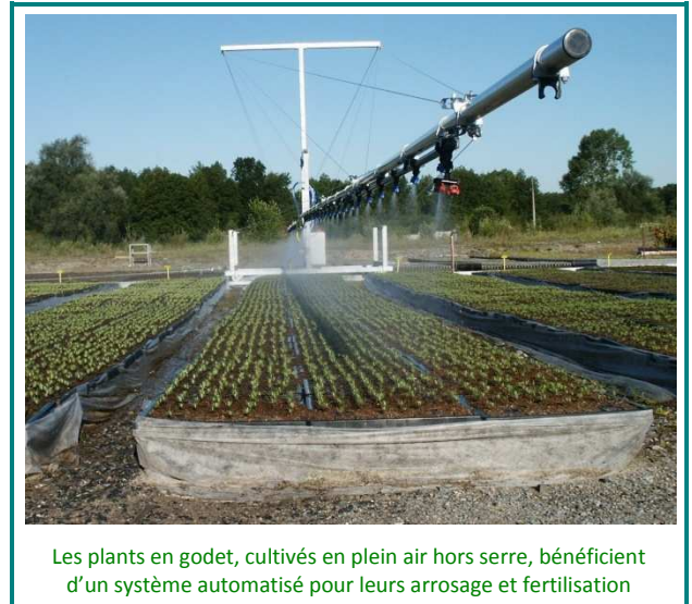
Les plants en godet, cultivés en plein air hors serre, bénéficient d'un système automatisé pour leurs arrosages et fertilisations