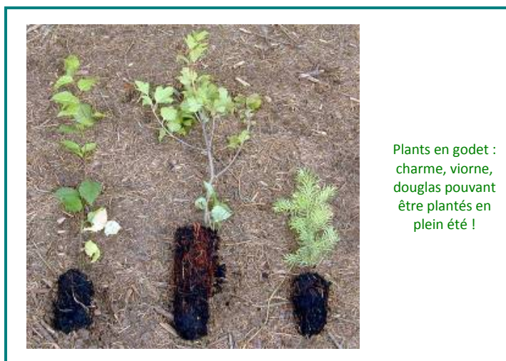
Plants en godet : charme, viorne, douglas pouvant être plantés en plein été !