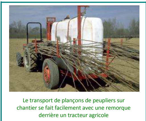
Le transport de plançons de peupliers sur chantier se fait facilement avec une remorque derrière un tracteur agricole

En particulier, les peupliers et saules sont multipliés à partir de boutures de rameaux (appelées plançons), à savoir des jeunes branches bien vivantes, munies de leur écorce et de leurs bourgeons.