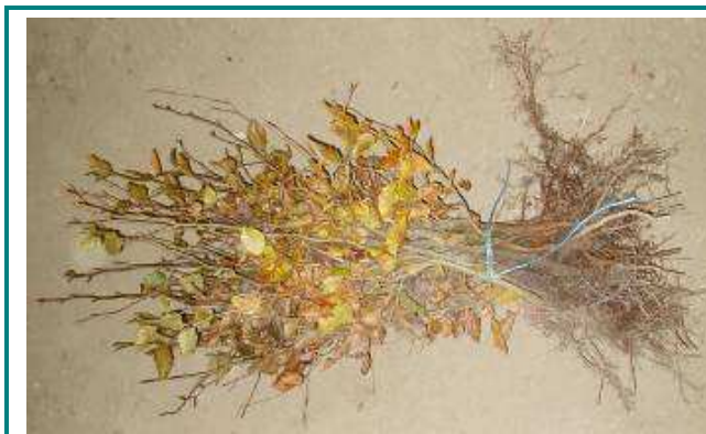
Plants à racines nues : hêtre S 2 R 2 (2 ans de semis, 2 ans de repiquage) de 110 cm de hauteur

Cette production est utilisée pour la majorité des essences à reprise facile , à condition de respecter les précautions de transplantation, de transport et de plantation.