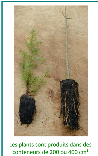
Les plants sont produits dans des conteneurs de 200 ou 400 cm 3