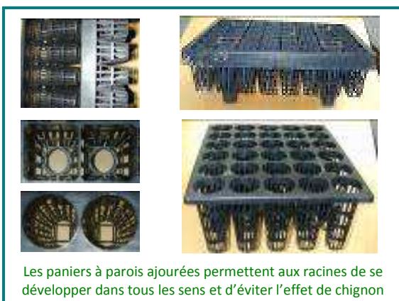
Les paniers à parois ajourées permettent aux racines de se développer dans tous les sens et d'éviter l'effet de chignon