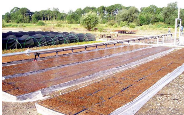
Irrigation par aspersion : eau apportée sous la forme de pluie artificielle