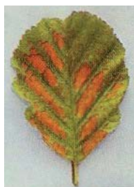
Nécroses brun rougeâtre entre les nervures de feuilles d'aulne carencées en Ca