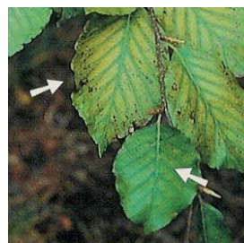
Carence en magnésium chez le hêtre