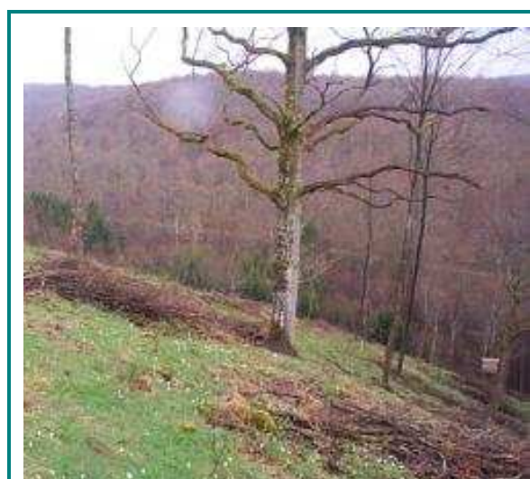
Le chêne pédonculé en rupture de pente n'est pas dans son optimum écologique, il devient alors plus fragile

Toutefois, il faut rappeler l'importance de l'adéquation des espèces de chênes à la station et le rôle de la conduite des peuplements en tant que facteurs prédisposants.