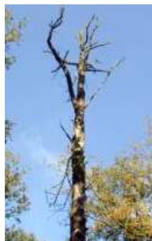
Chêne isolé mort

Le dépérissement des chênes indigènes peut apparaître soit par bouquets allant jusqu'à une dizaine de sujets à différents stades d'évolution mélangés avec des arbres apparemment sains, soit par petits groupes de 3 - 4 chênes, soit par arbres isolés .