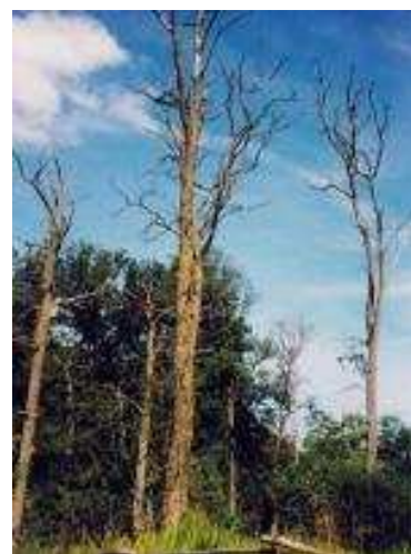
Bouquets de chênes dépérissants

L'âge des sujets dépérissants, va de 60 à 150 ans, ce qui n'exclut pas la sensibilité de sujets plus jeunes.