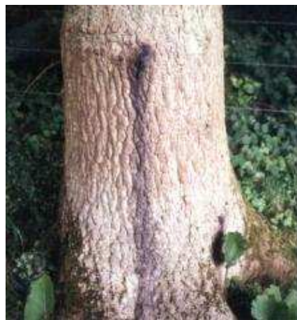
Soyez vigilants : ces écoulements noirâtres dus à un ensemble de causes d'origine complexe annoncent la mort prochaine du chêne

Le classement CEE de l'état sanitaire des chênes distingue cinq classes sanitaires, de l'état sain (classe 0) au stade final d'arbre mort (classe 4).