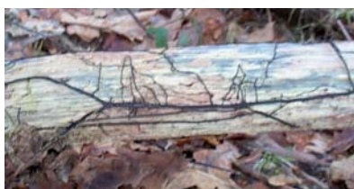
Mycelium en filaments aplatis de l'Armillaire