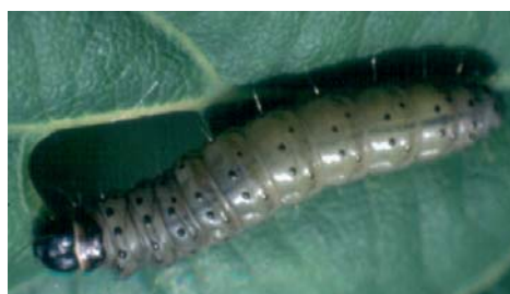
Tordeuse verte du chêne