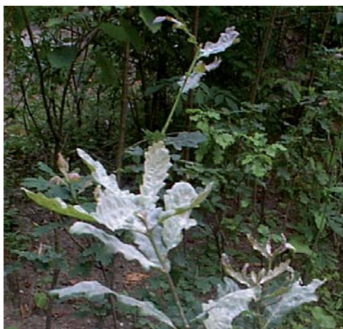
Feutrage blanc de l'Oïdium sur feuille de chêne